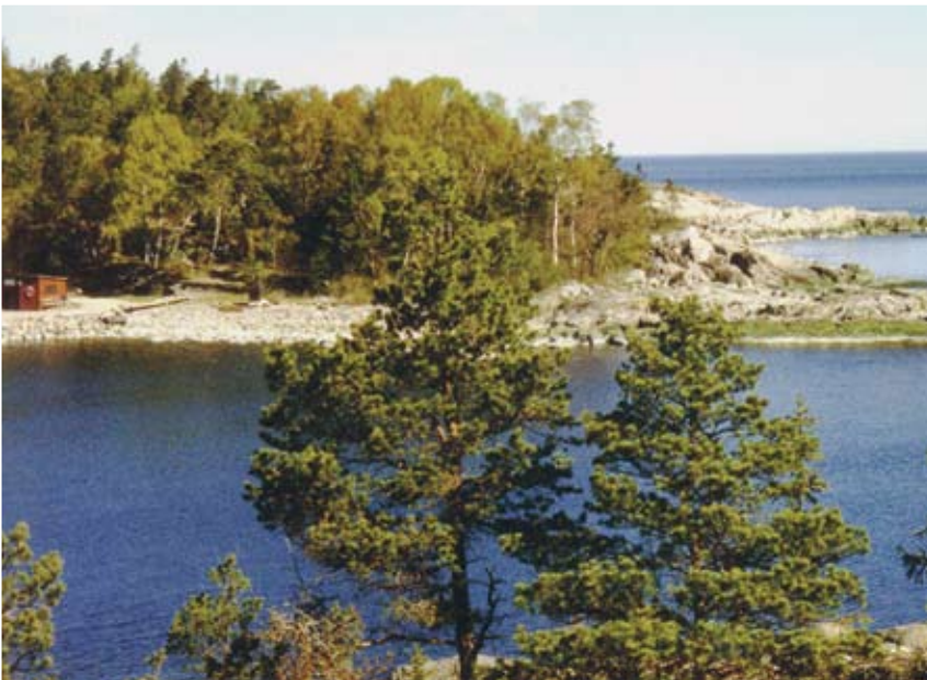
Utsikt över Nothamn mot norr. De ljusa bergarterna består av marmor och vulkaniter.