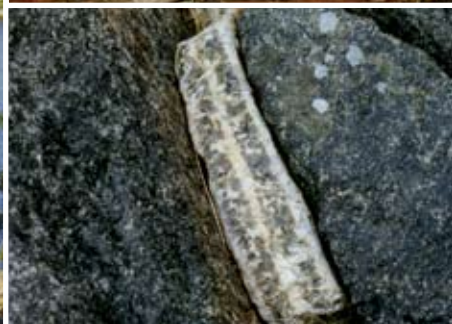
Övre bilden: Nära lokal 2b Bytsudden. Rödfammiga metaryoliter med inlagrade basiska mörka lavalager. I bakgrunden syns marmor. Nedre bilden: Zonerad pegmatit i gabbro mellan lokal 6 och 7 - nära kontakten med gabbrofragmentet.