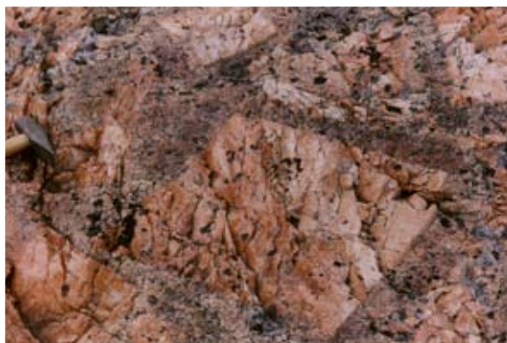
Till vänster: Närbild på veckad lava, lokal 1 Norrudden. Till höger: Stora kalifältspatkristaller omgivna av skriftgranit, återfinns mellan de två små pegmatitbrodden, Rödberget (se faktarutan, sid 26).