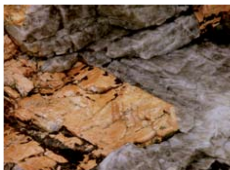
Detalj från lokal 5 visande en tre decimeter stor kalifältspatkristall i kvarts.