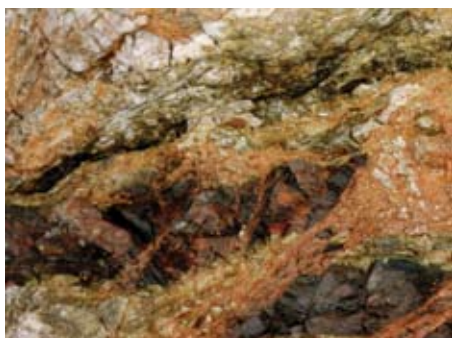
Vid Bytsudden, lokal 2b. Laumontitläkt breccia i marmor och amfibolit.